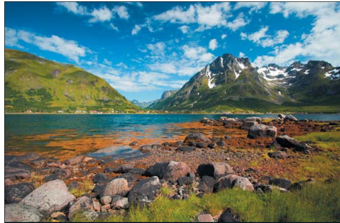
Krajina na souostroví Lofoty, Norsko – červenec 2011

Fotografování mi přináší velké potěšení. Život mi do cesty našťastí přihlál „parťák“, který sdílí mé nadšení pro cestování a fotografování v přírodě, a proto na většinu cest vyráží se svou ženou. Za ta léta se hodně naučila, nyní se již obstojně orientuje v mém fotobatohu a navíc začala sama natáčet. Před třemi léty jsme se poprvé dostali do polárních oblastí a zamilovali jsme se do Norska a Finska, a to především do jejich severních oblastí. Během následujících let jsem proto podnikl cesty na Špicberky a na Jižní Georgii. Polární a subpolární oblasti jsou místa, na která se chci v budoucnu ješ-