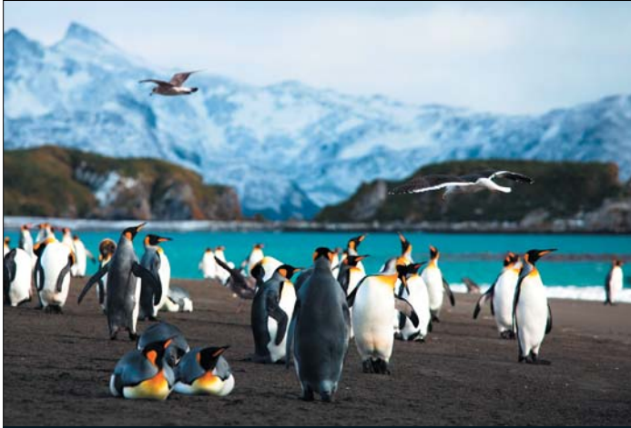
Tučňáci patagonští, Salisbury plain, Jižní Georgie – březen 2013