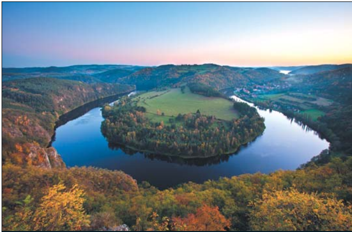
Meandr Vltavy, ČR – říjen 2011

hodně bojuji, mi díky fotografování a asi i přibývajícím létům jde mnohem lépe, neboť ta rána v přírodě a hra světla za tu trochu nepohodlí rozhodně stojí.