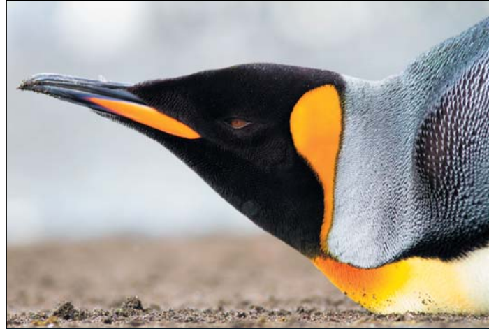
Tučňák patagonský, Jižní Georgie – březen 2013